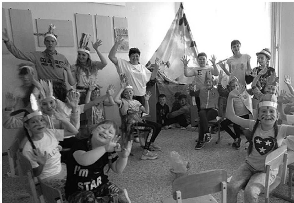
Лето – время чудес и открытий, время солнца, улыбок, проказ. Школьный лагерь – одно из событий Приготовило лето для нас!

Где еще школьник может почувствовать себя раскрепощенным, свободным, независимым как не в период летних каникул в пришкольном лагере. Поэтому 4 июня распахнул свои двери лагерь «Солнышко» при МКОУ СОШ №2. Лето – это, прежде всего солнечные и теплые деньки, поэтому наш лагерь называется «Солнышко». «В тридевятом царстве...» – девиз смены 2019 года. Несмотря на то, что прошла только половина лагерной смены, произошло немало интересных событий, о которых я бы хотела рассказать.